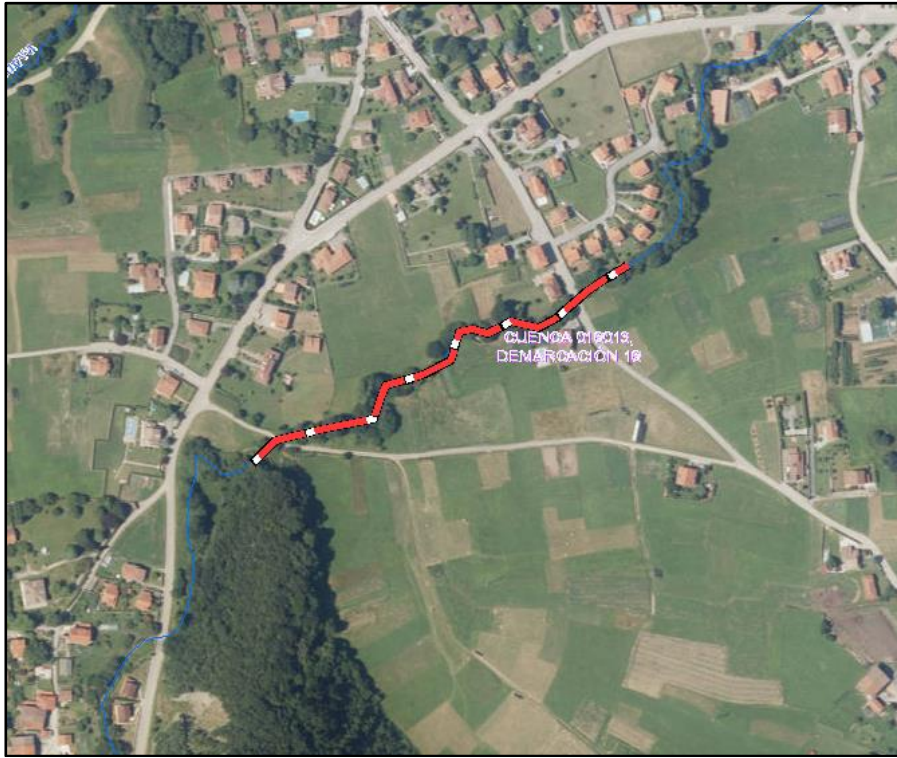
Localización de la actuación