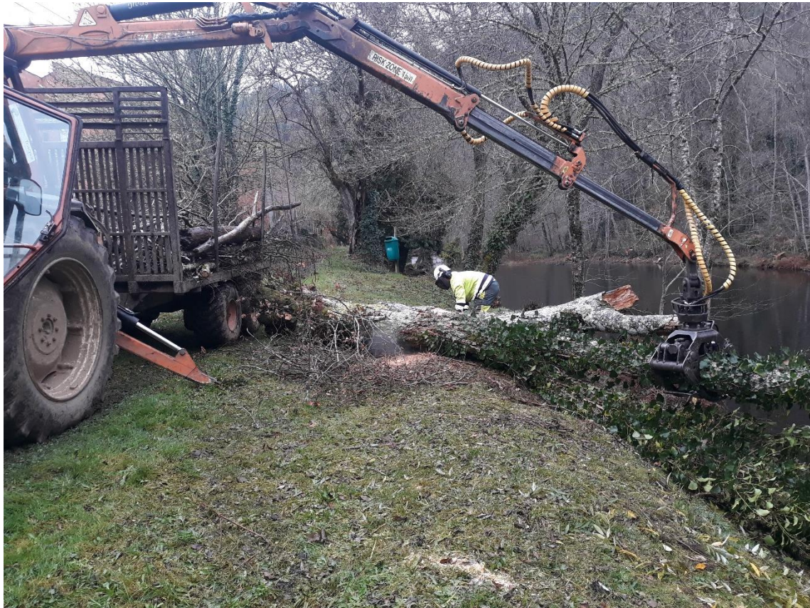
Retirada de arbolado