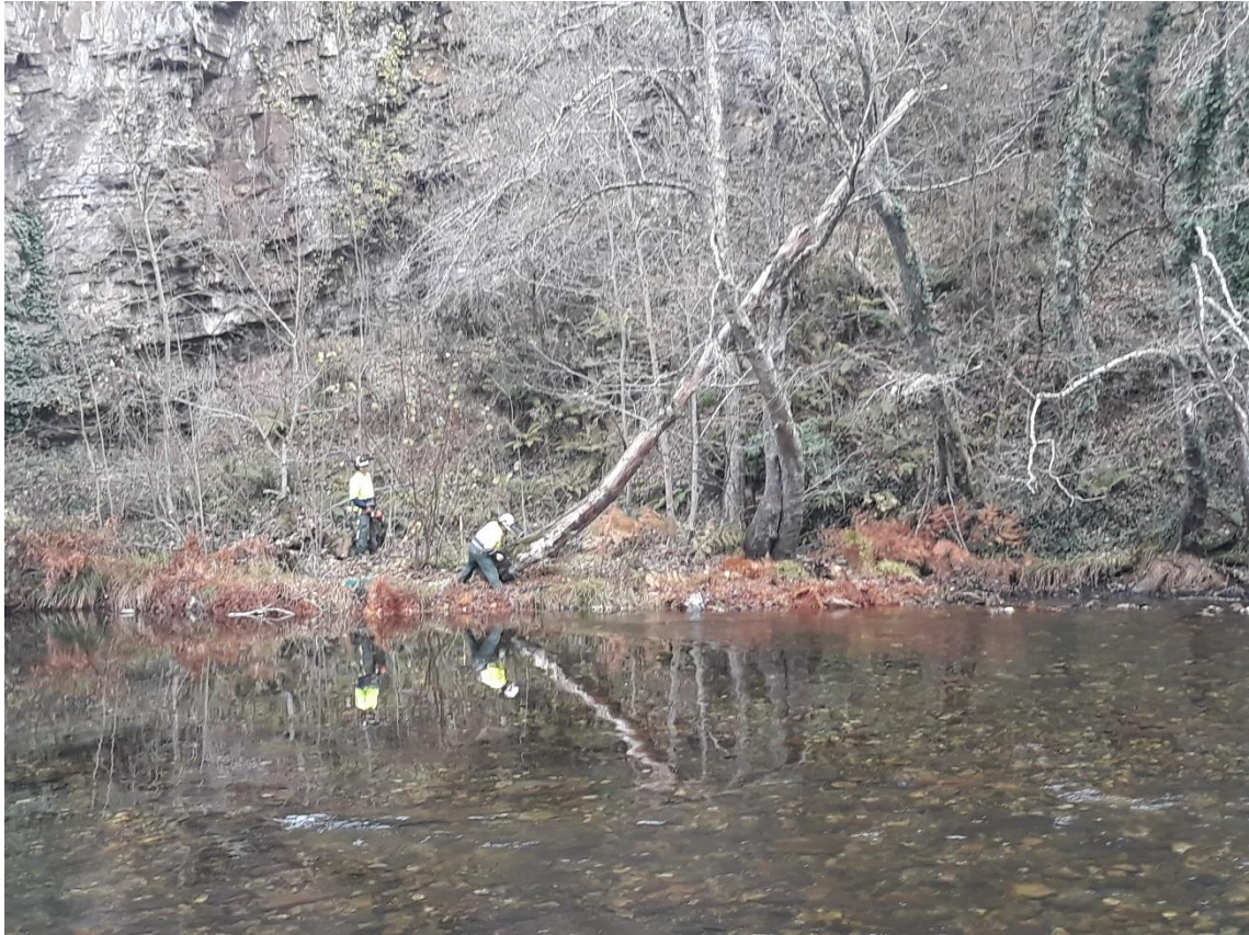
Retirada de árbol caído