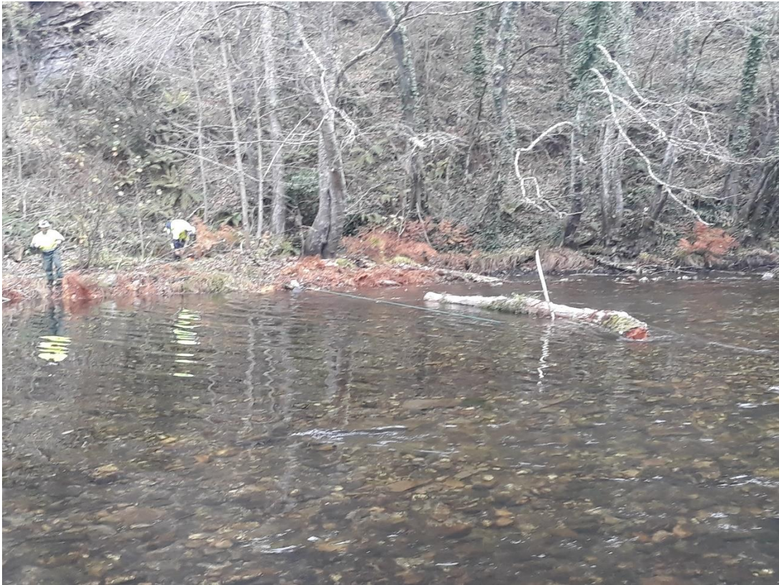
Retirada de restos vegetales