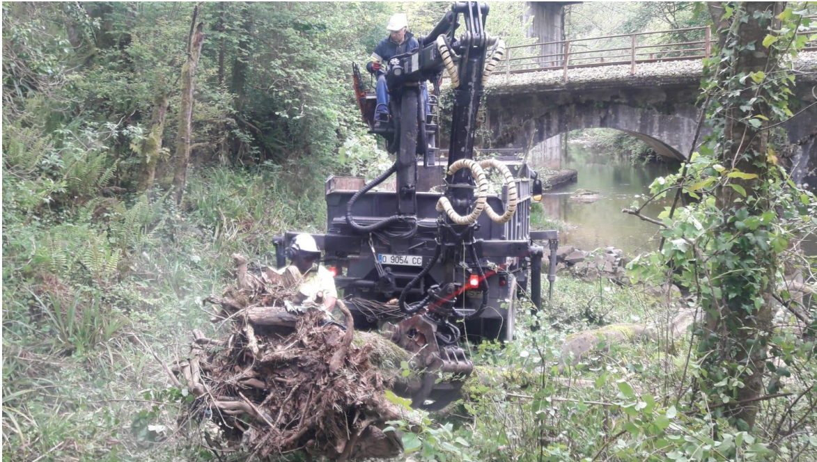
Carroceta y operario sacando del río un árbol caído