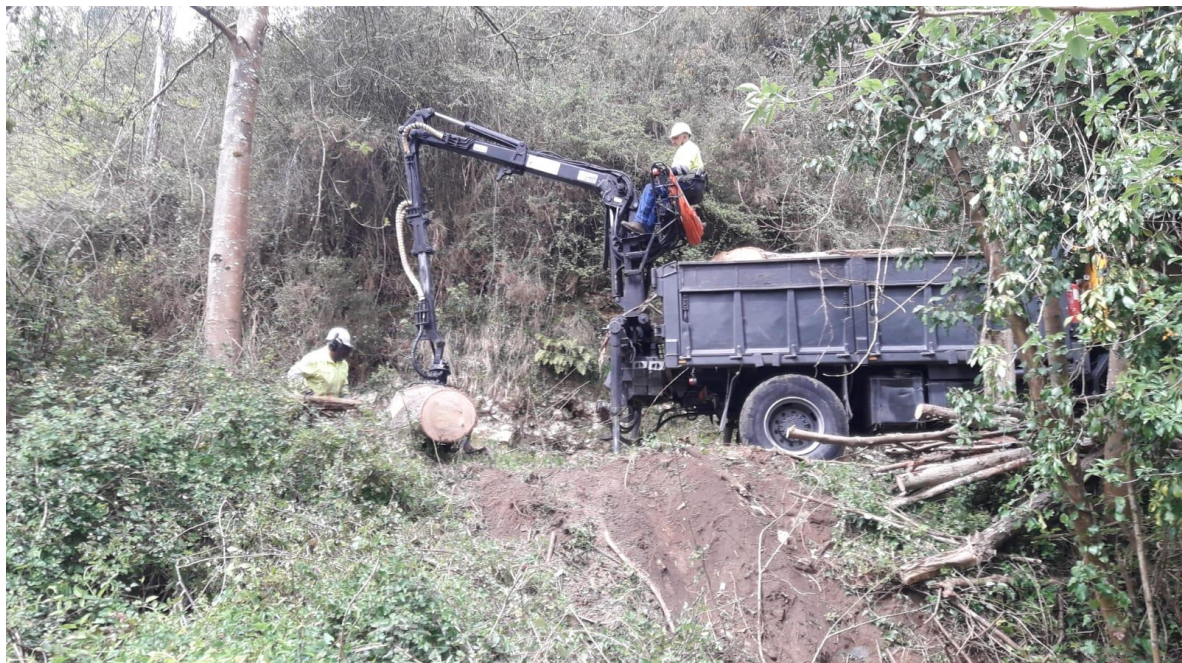
Carroceta cargando madera