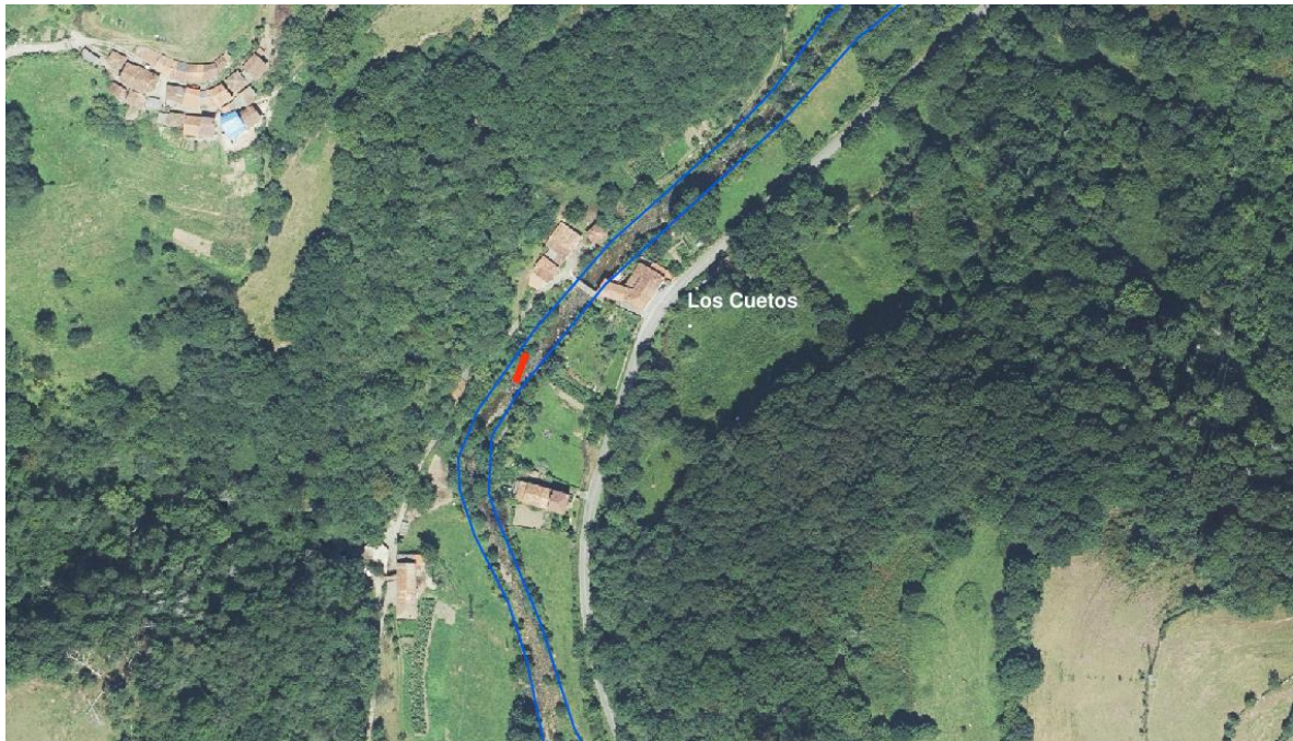
Zona de actuación en el río de La Marea, en Los Cuetos