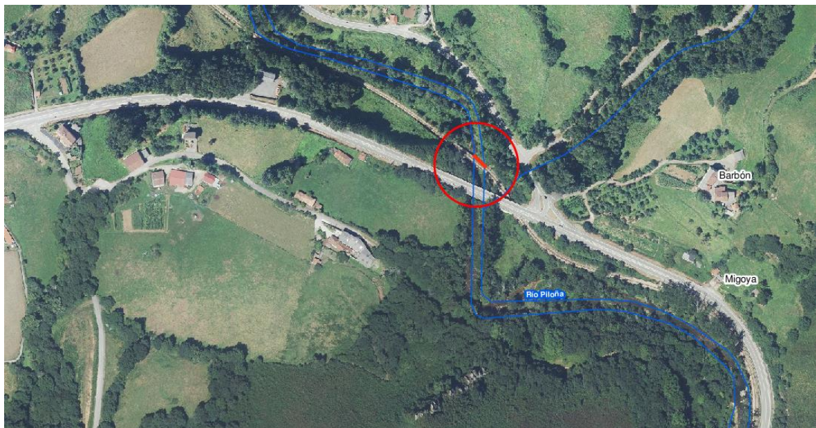
Tramo de actuación en el río Piloña, en Migoya