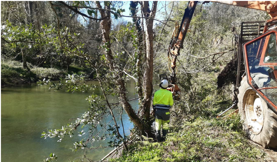
Operario extrayendo restos vegetales del río Eo