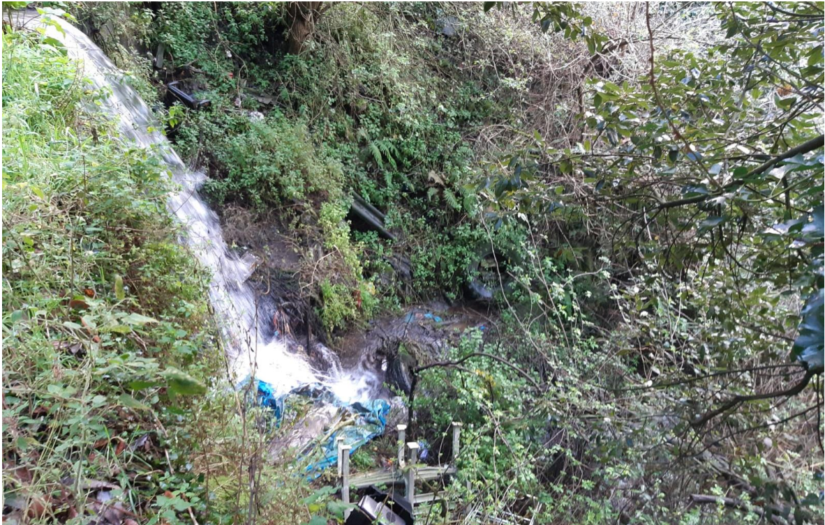
Arroyo innominado antes de la actuación