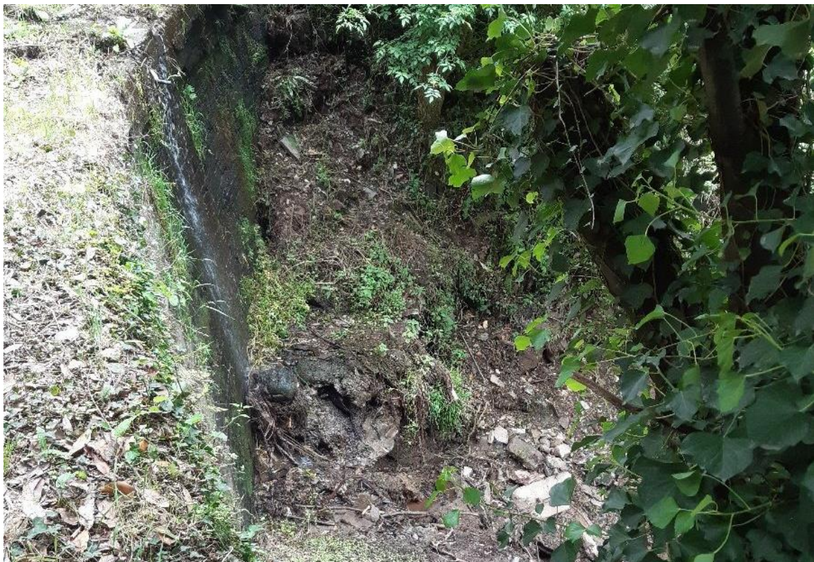
Arroyo innominado después de la actuación