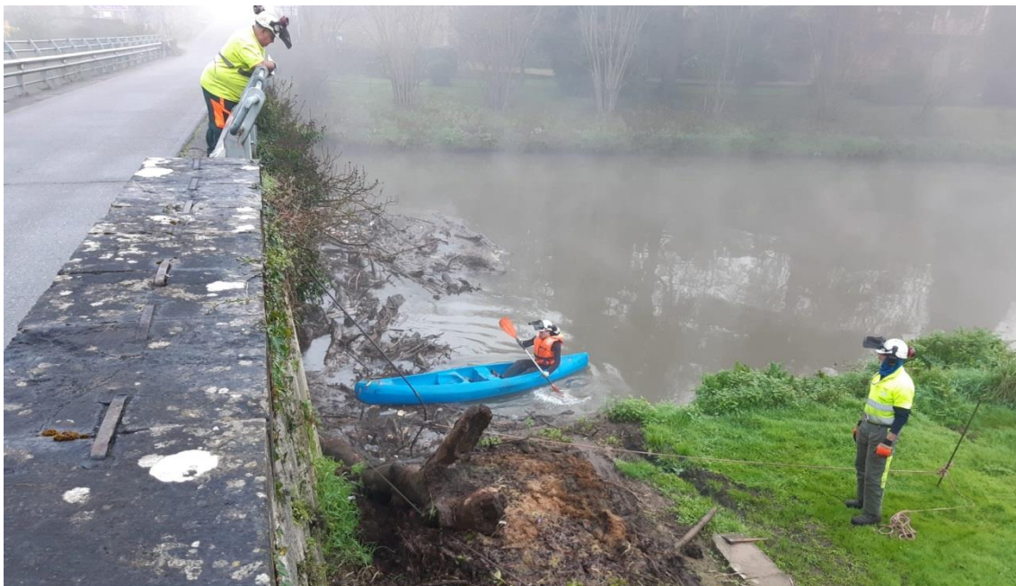
Operario en canoa se acerca a los restos vegetales para engancharlos con eslinga y sacarlos del río con la ayuda de un autocargador. Río Nora en San Pedro de Nora