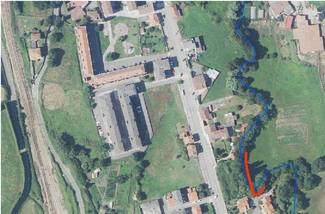
Localización de la actuación - río Alvares en Cancienes