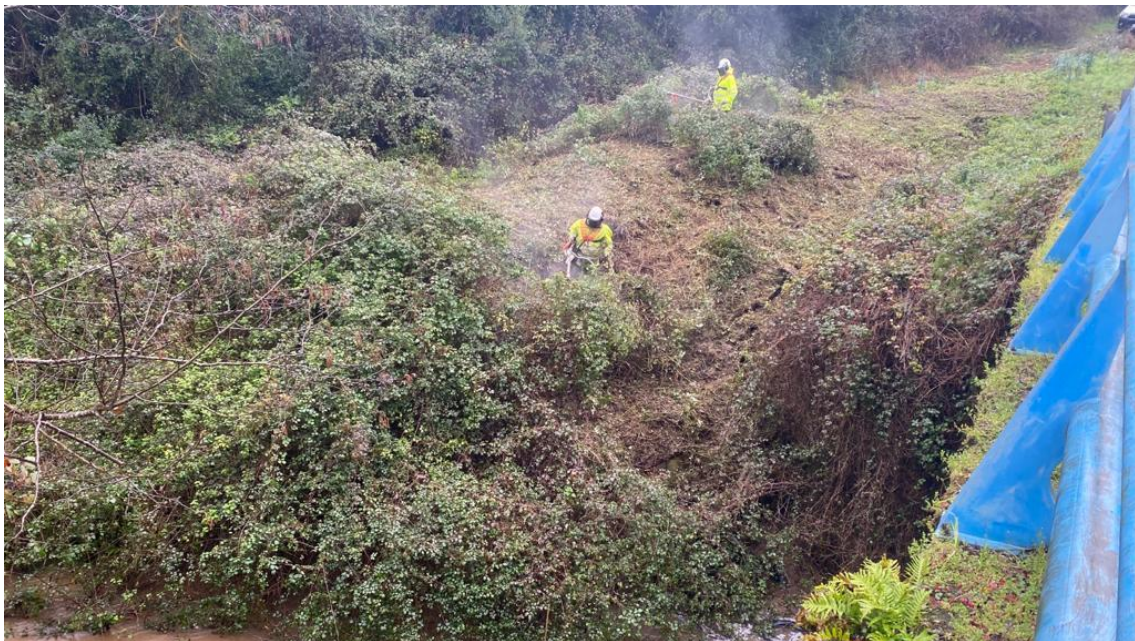
Operarios desbrozando en el río Andallón en Pumeda