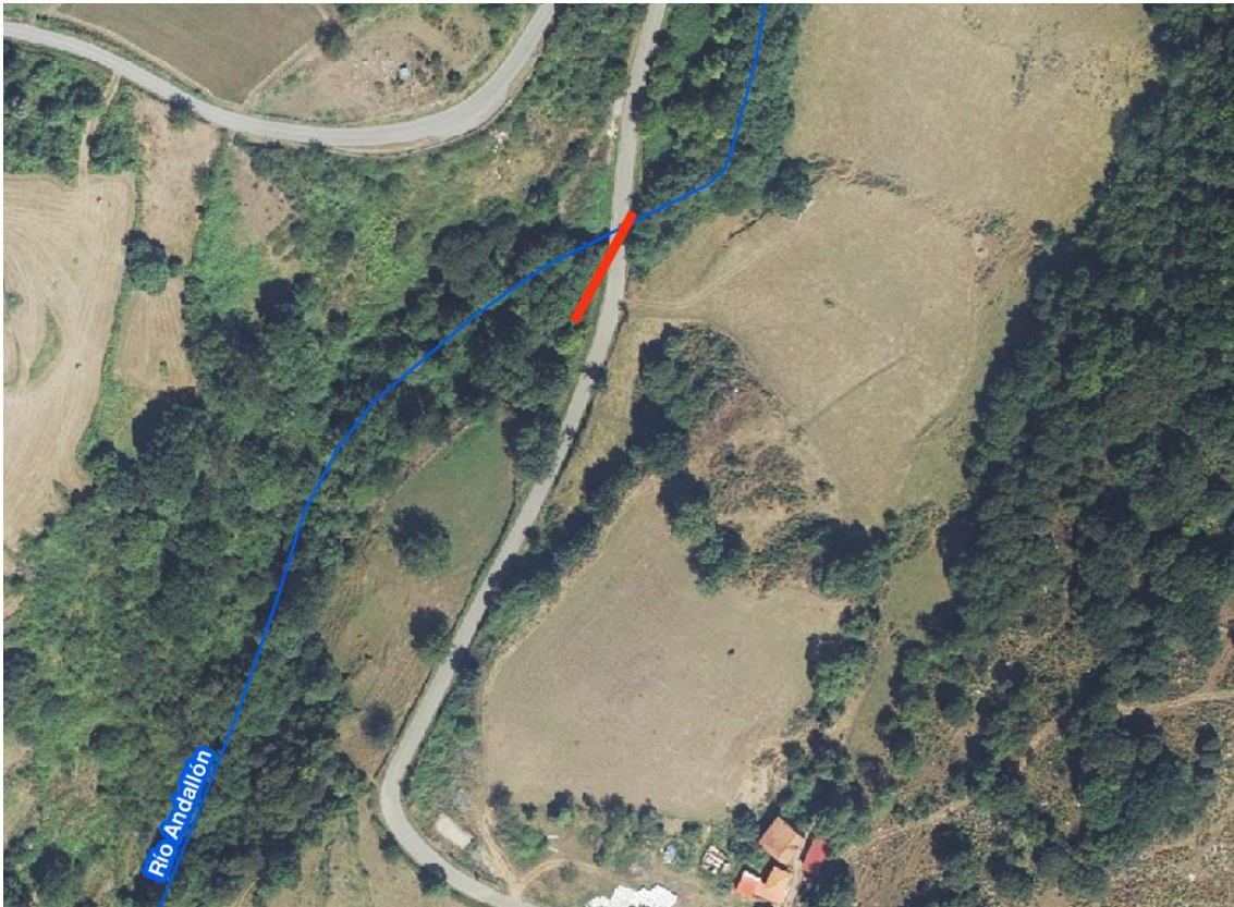
Localización de la actuación - río Andallón en Pumeda