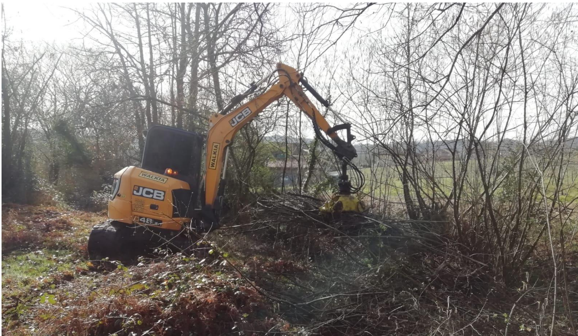
Mini-retro sacando madera del arroyo la Reguerona en Aramil