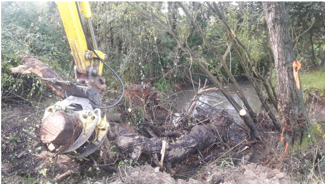
Mini-retro sacando tronco del río Alvares en Cancienes