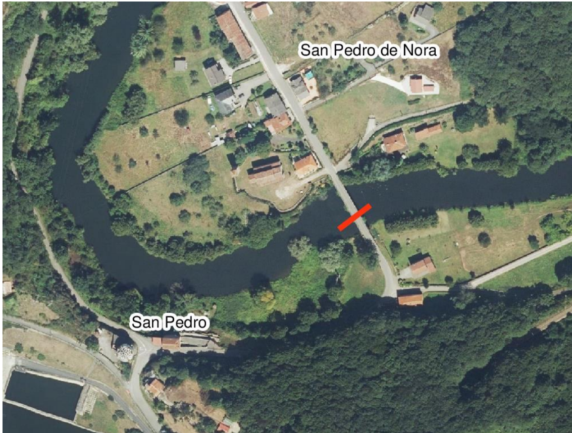
Localización de la actuación - río Nora en San Pedro de Nora