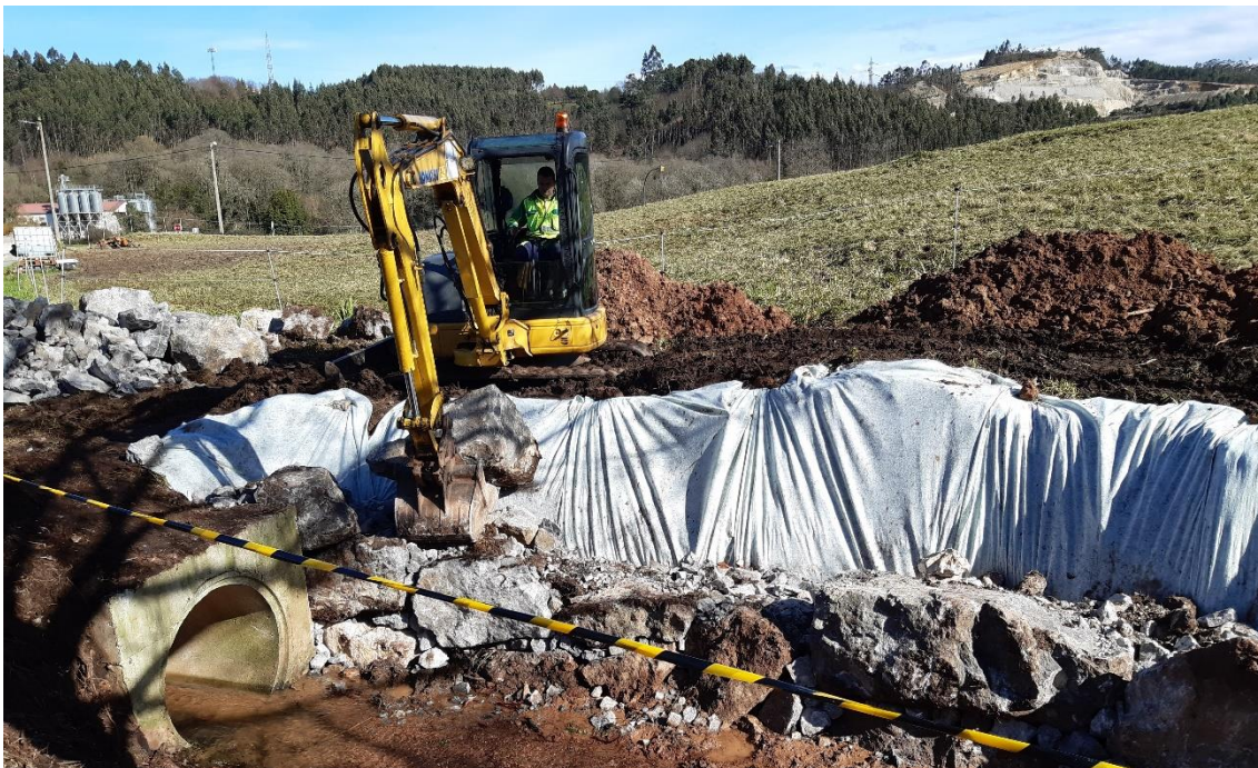
Ejecutando talud de escollera en el arroyo el Rabón en Cancienes