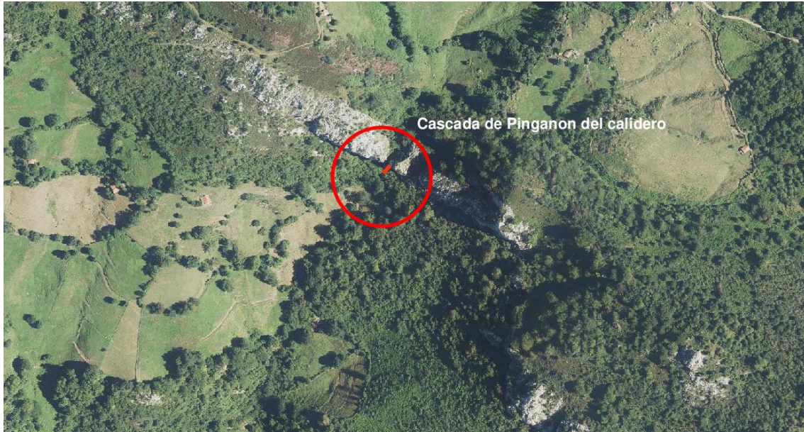
Localización de animal en cascada del Pinganon del Calidero