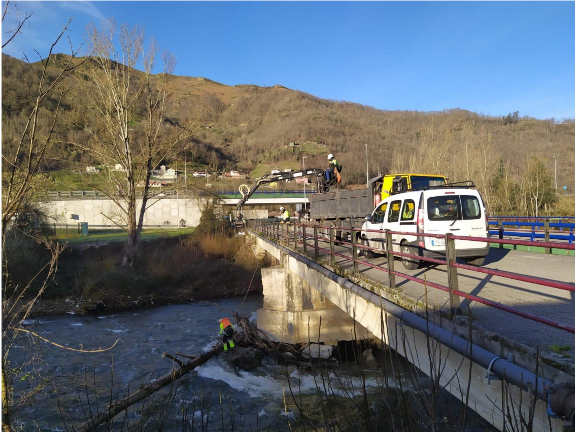
Operarios extrayendo tronco de árbol retenido en pila de puente