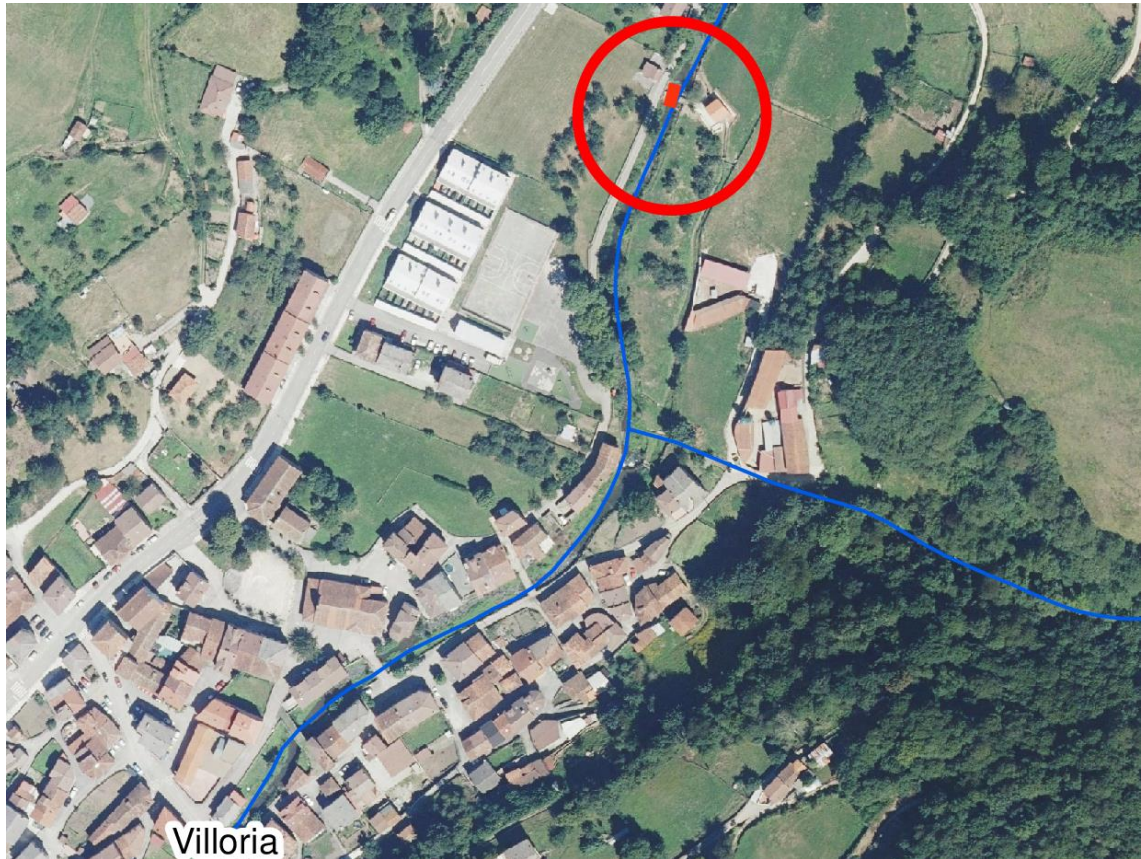
Localización de animal en el río Villoria