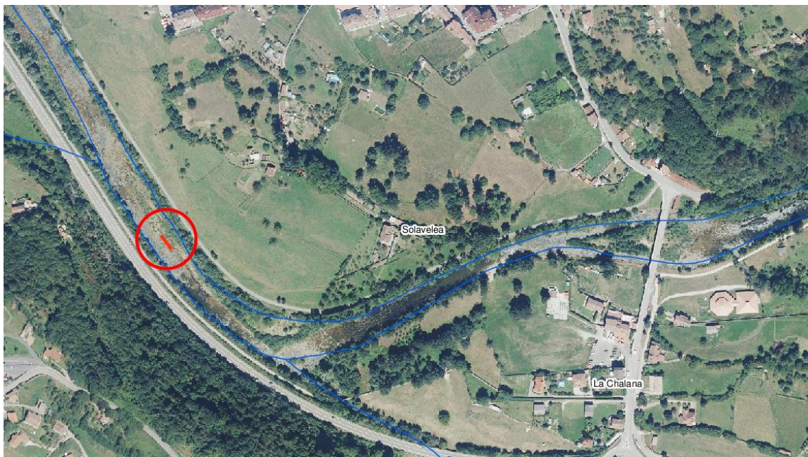
Localización de animal en río Nalón a la altura del puente de la Chalana