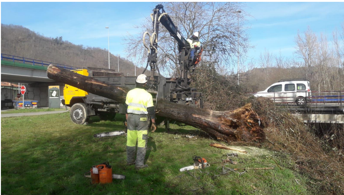
Operarios retirando tronco