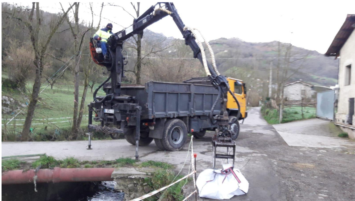
Operarios retirando animal