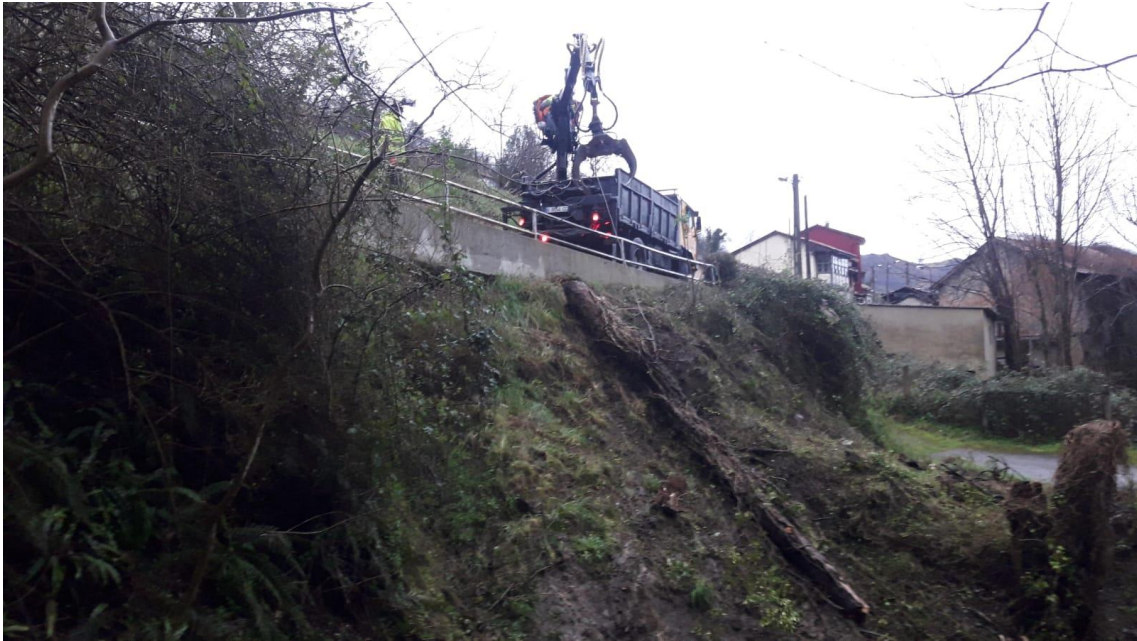
Operarios sacando tronco