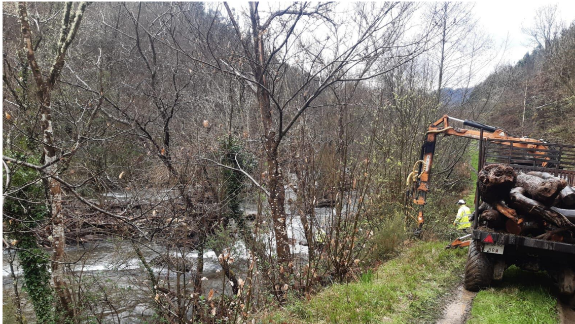
Autocargador retirando tronco del río Rodil en Os Cangos (Ribeira de Piquín)