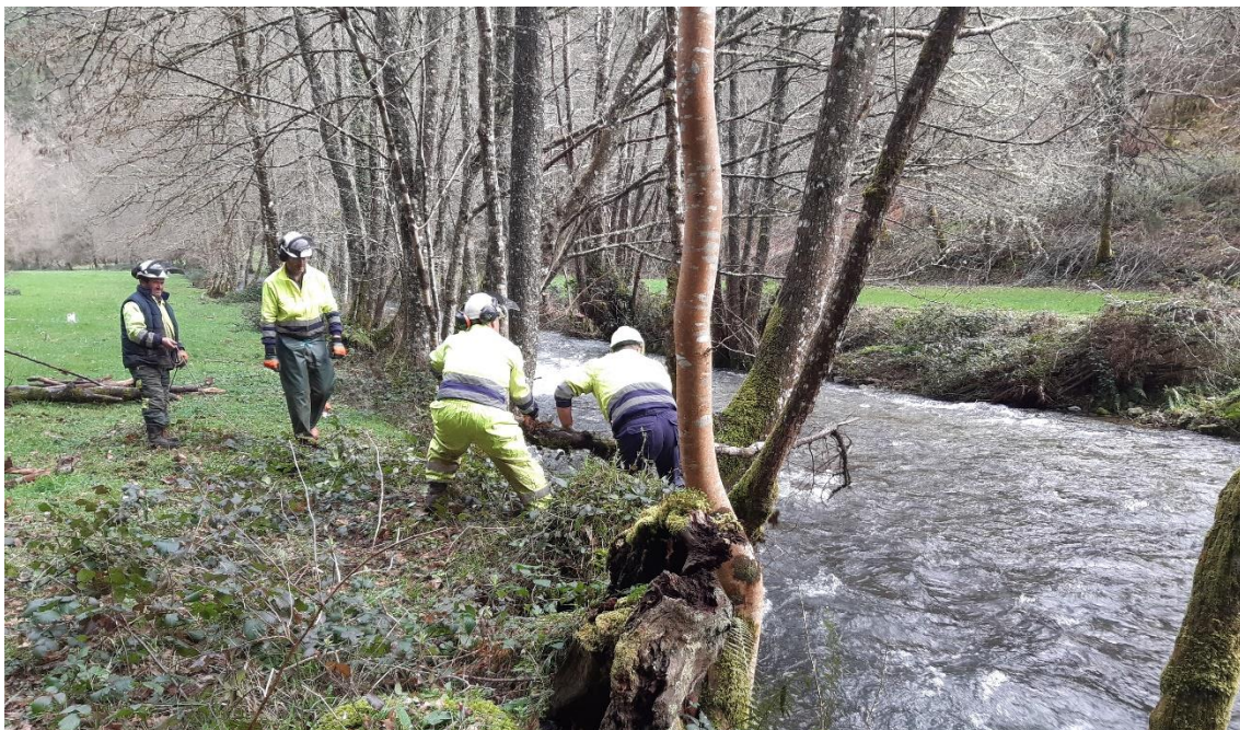
Operario sacando tronco del río Rodil en O Mazo