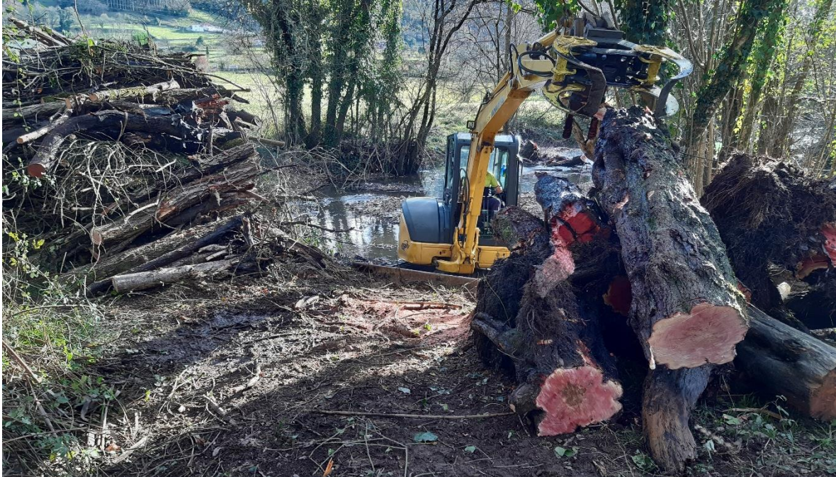
Mini-retro extrayendo árboles del río