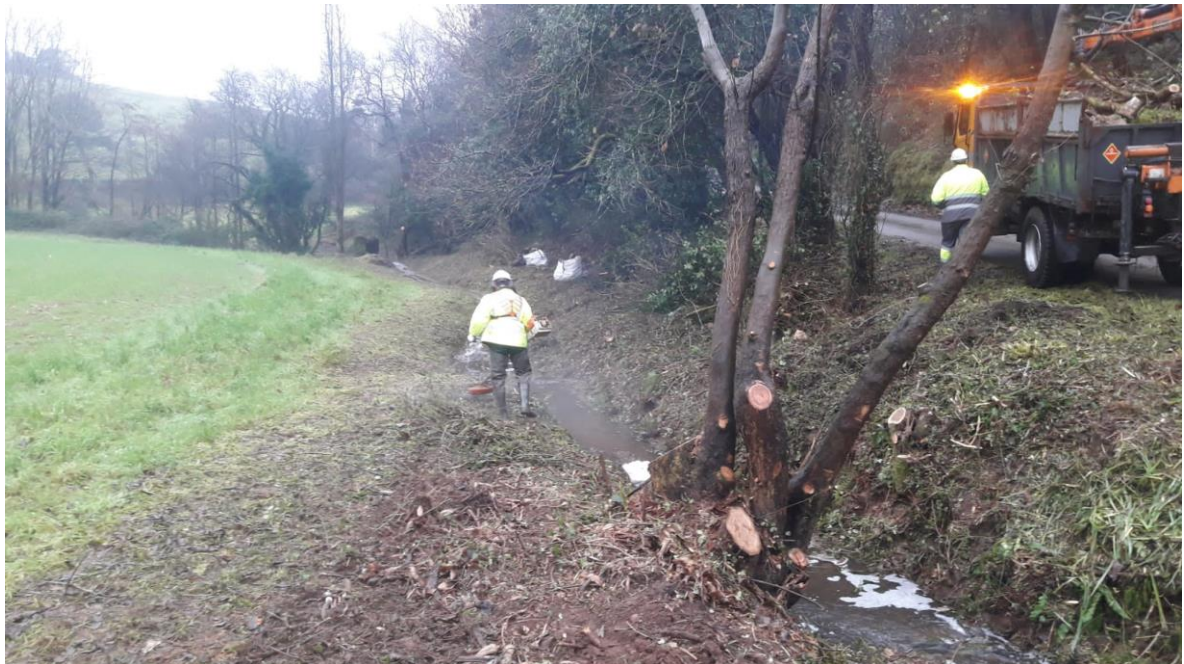
Operario desbrozando margen del cauce