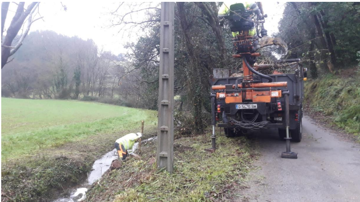
Operarios retirando madera