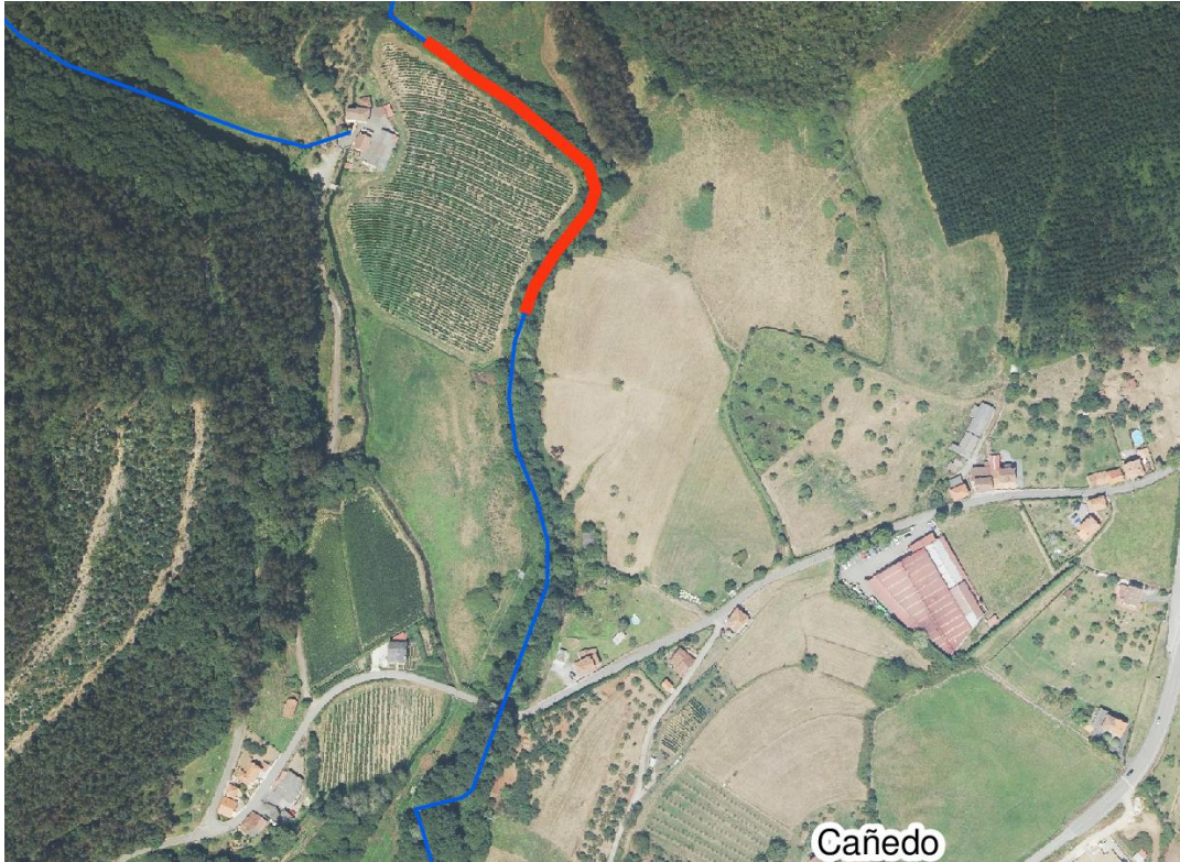
Localización de la actuación - río Aranguín