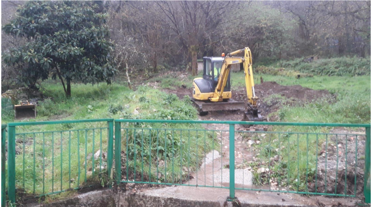
Mini-retro definiendo el cauce en el barranco de Cárcaba Romeu