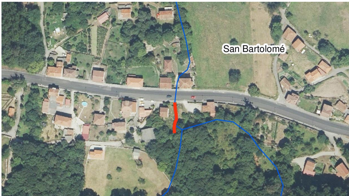
Localización de la actuación - barranco de Cárcaba Romeu