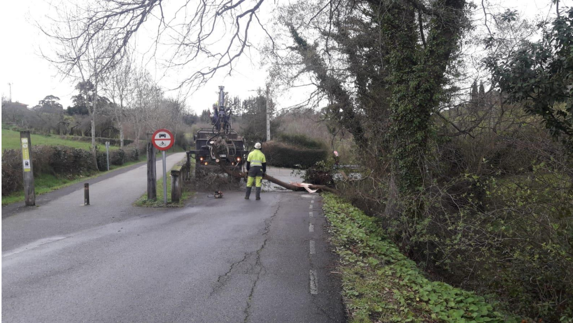
Retirada de arbolado