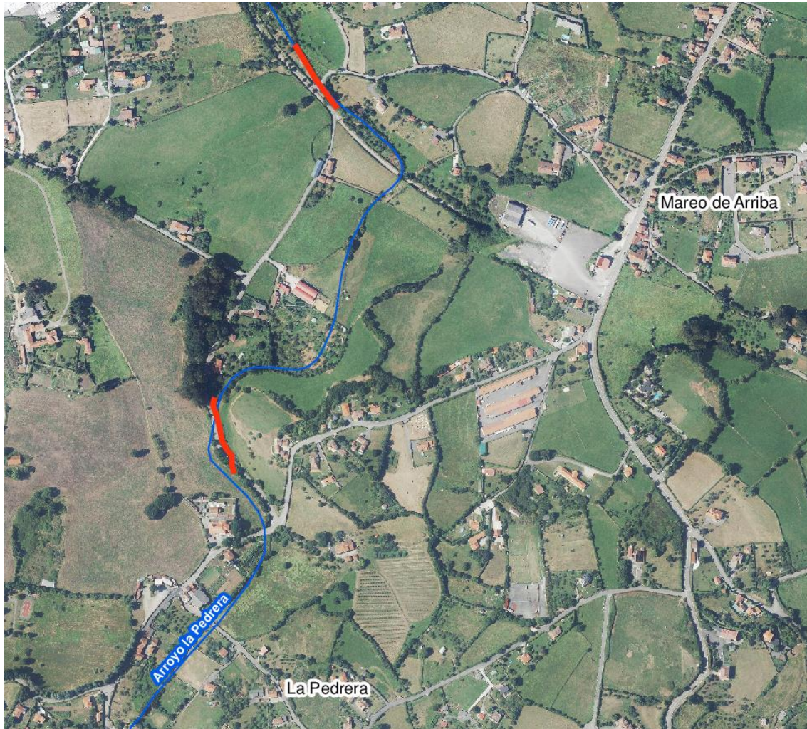
Localización de la actuación