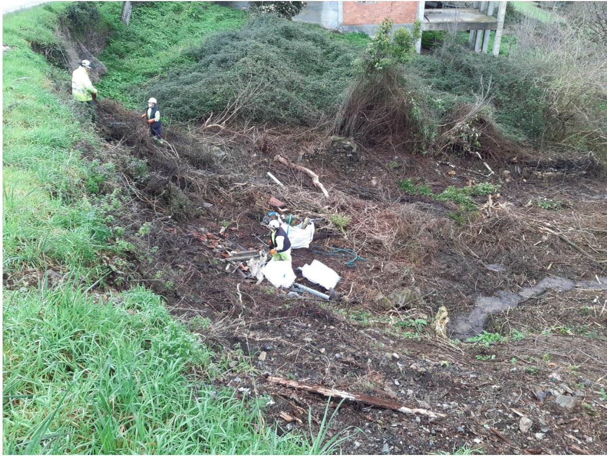
Operarios actuando en el vertedero