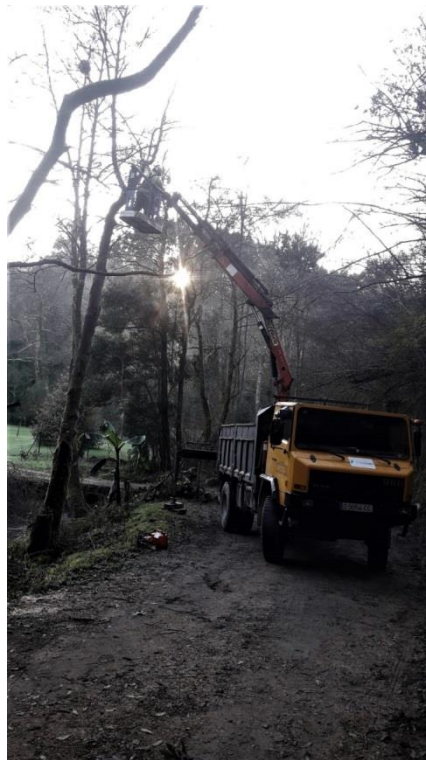
Operario cortando árbol en cesta en el río Ñora en Quintueles