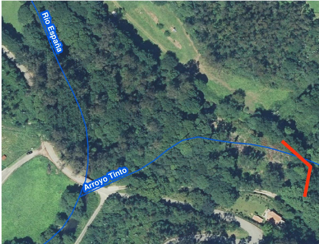
Localización de la actuación - río Tinto / arroyo Rioseco en Vega