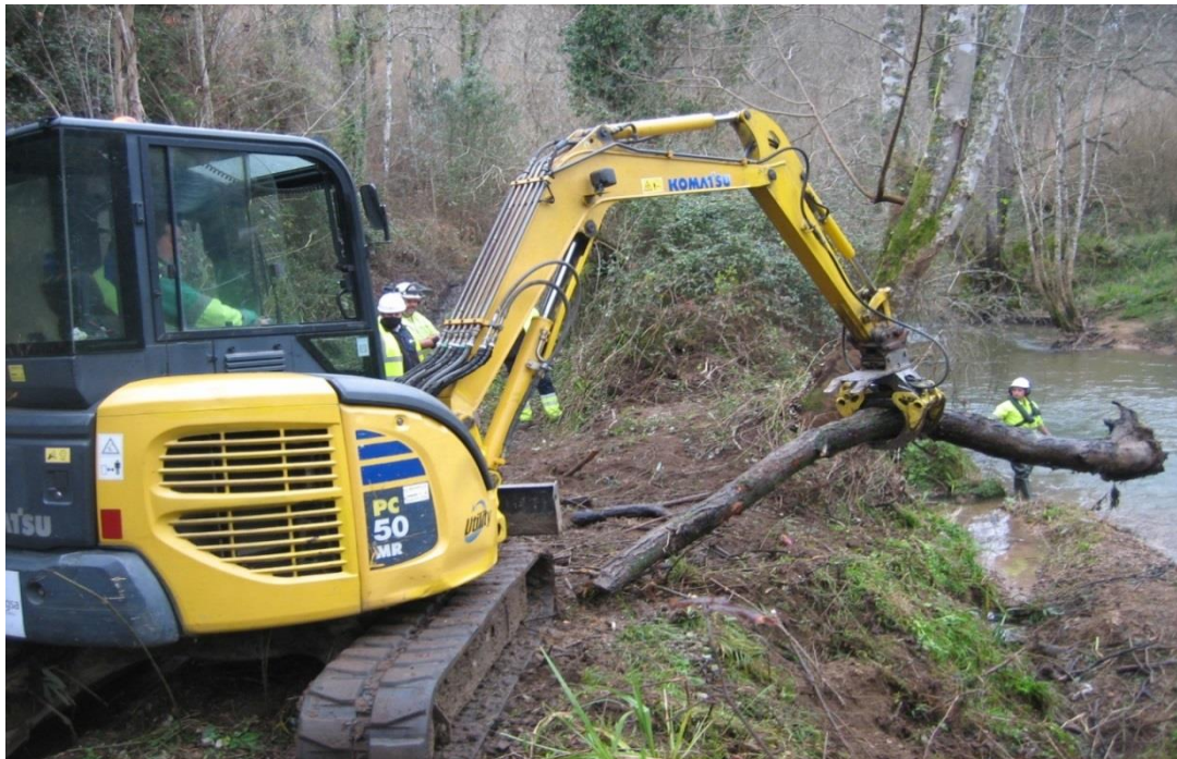
Retroexcavadora sacando madera en el río España en Vega