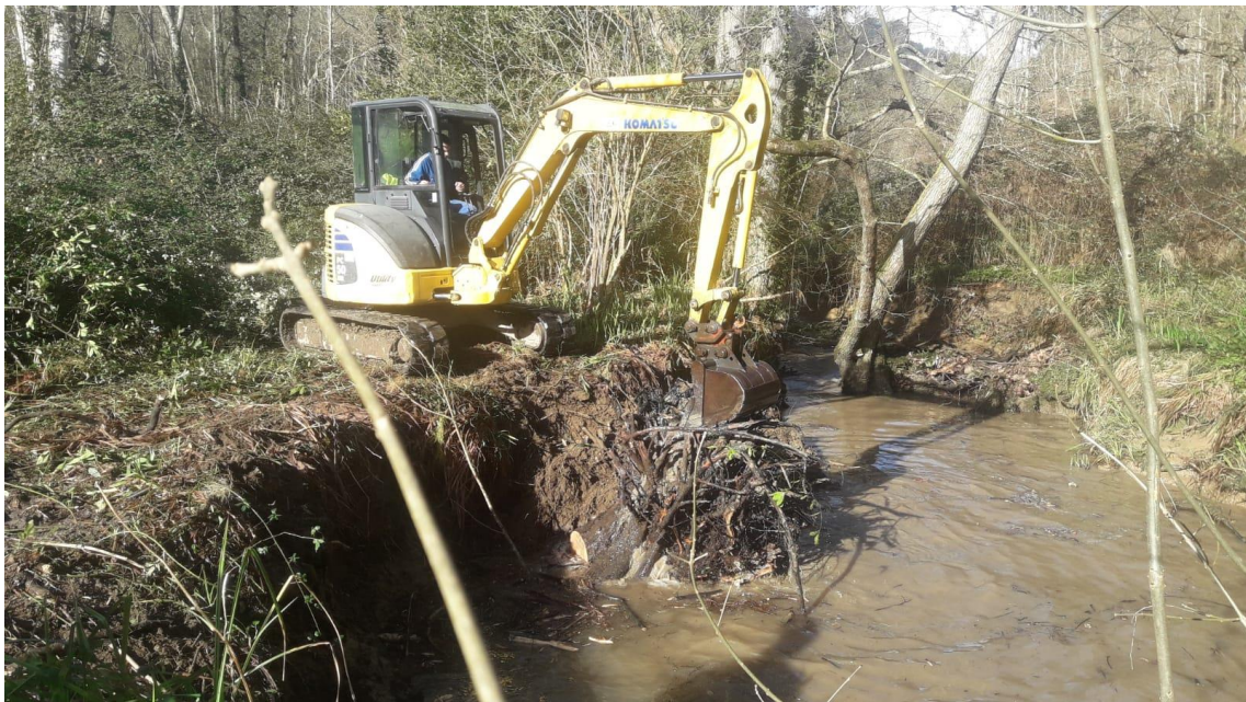
Retroexcavadora el río Tinto / arroyo Rioseco