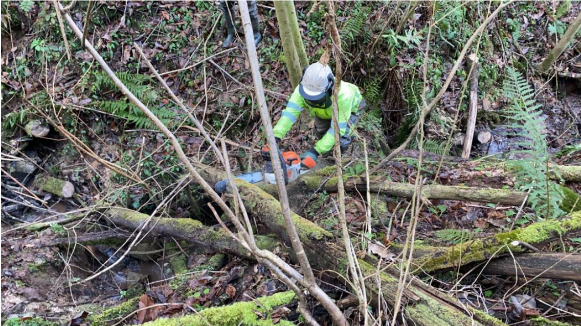
Operario cortando madera