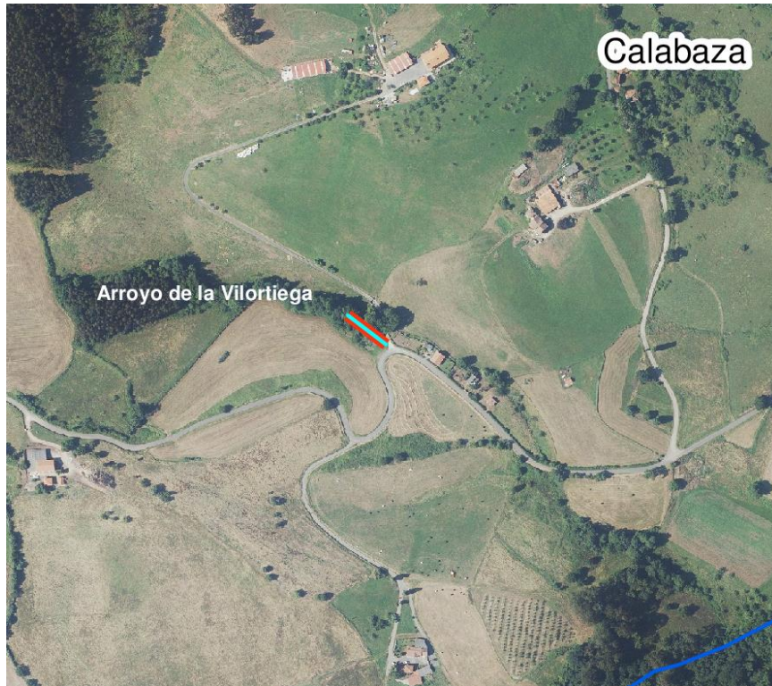
Localización de la actuación - arroyo Vilortiega en Calabaza