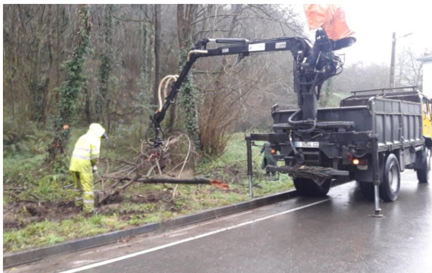
Retirada de restos vegetales