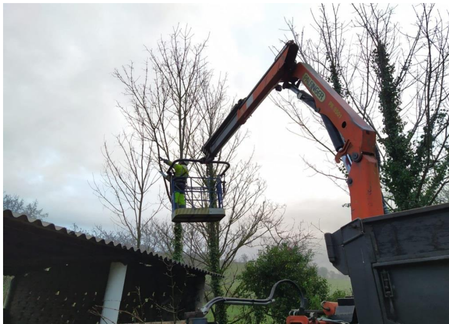
Operario cortando árbol en cesta