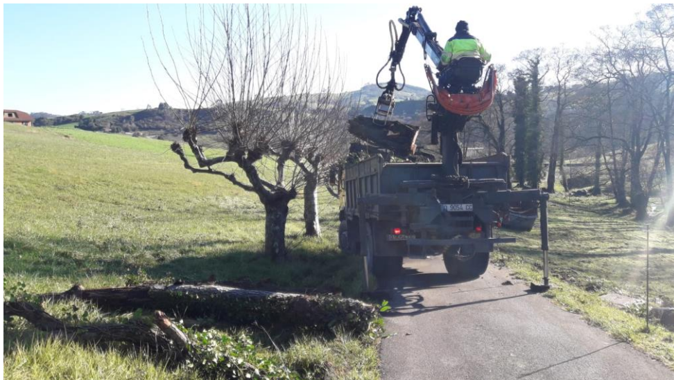
Retirada de arbolado