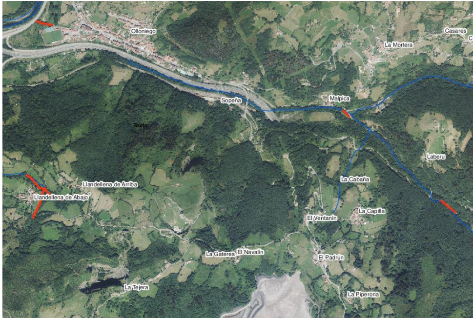
Localización de la actuación - arroyos Sanfrechoso, Caletano y Llosu