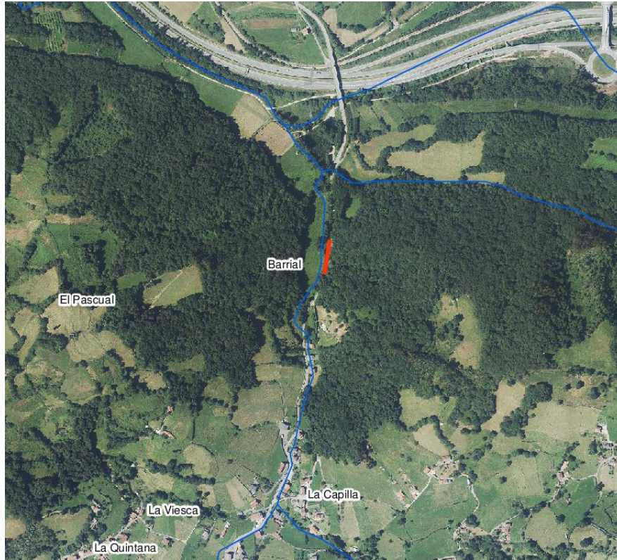
Localización de la actuación – arroyo del Toral en Traspando