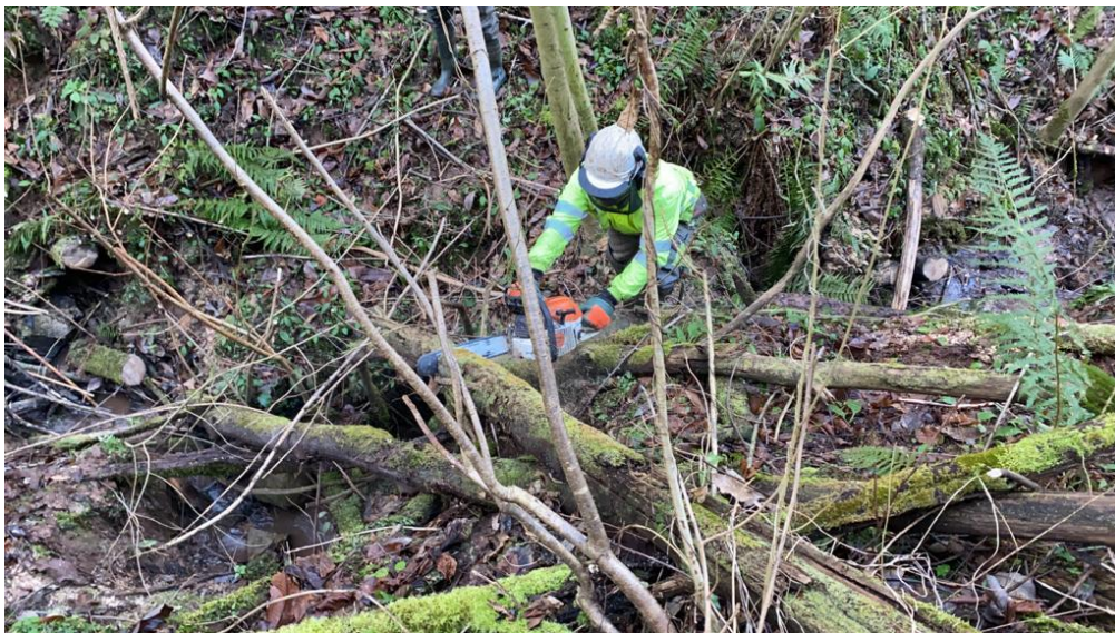
Operario cortando madera