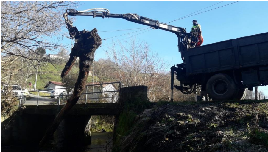
Retirada de arbolado