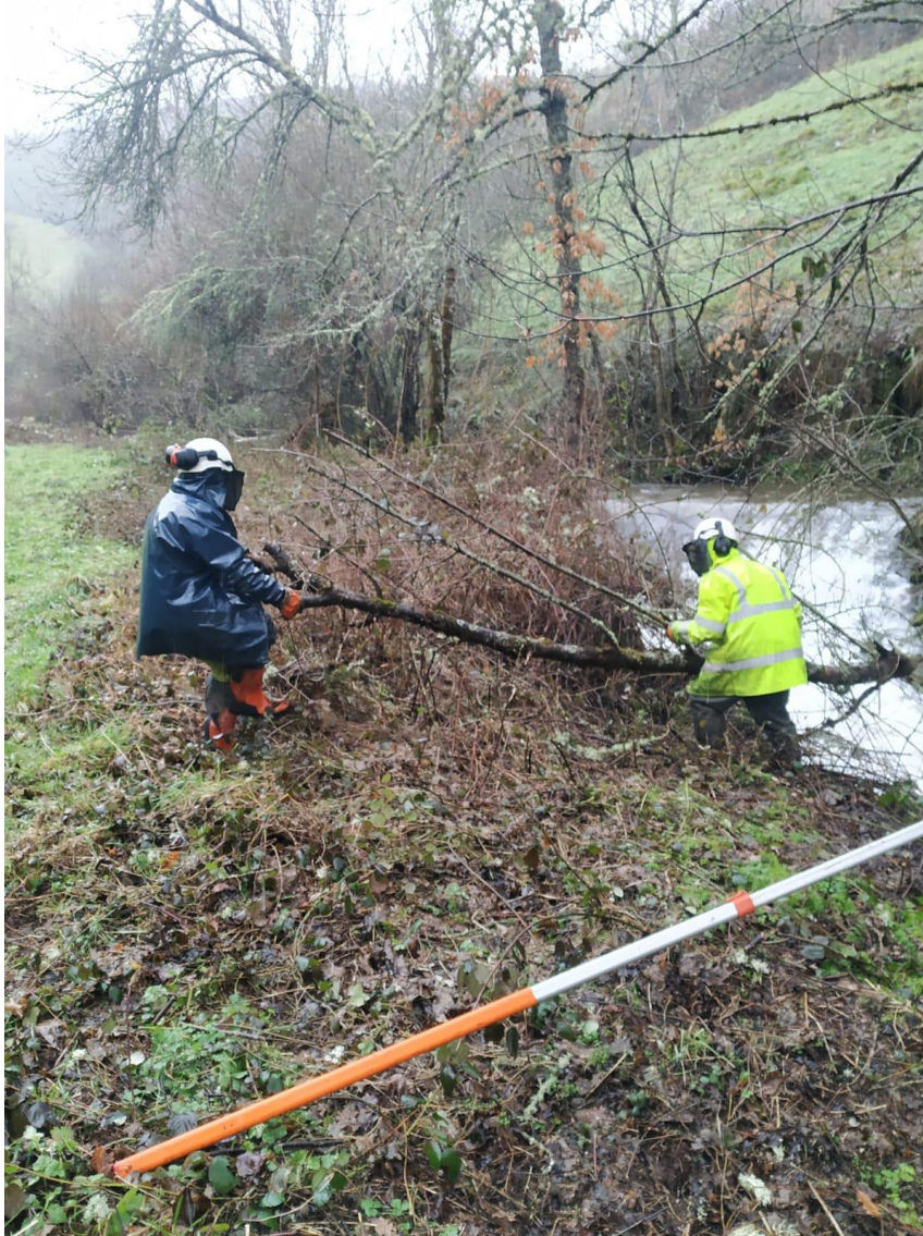
Retirada de arbolado