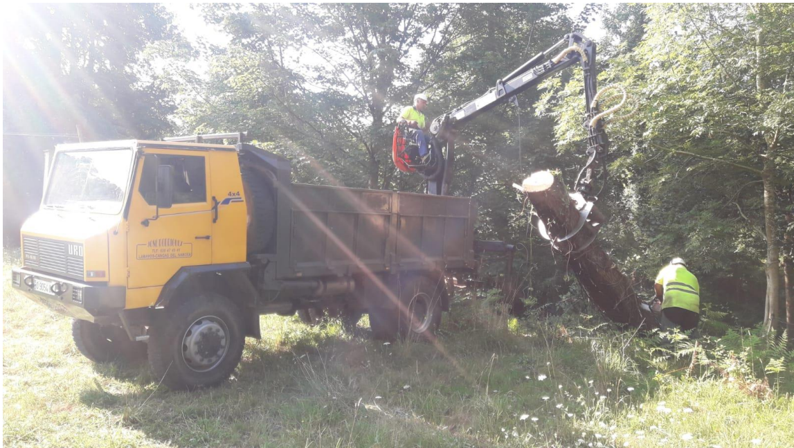
Retirada de vegetación