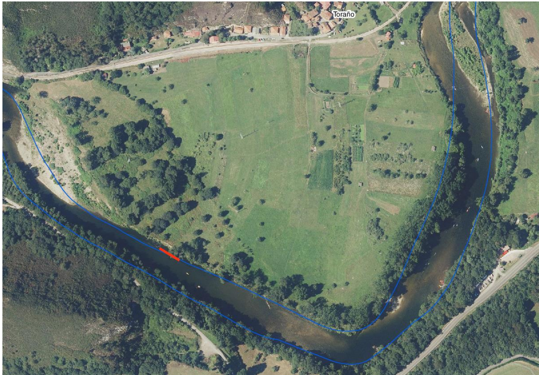
Localización de la actuación en el río Sella (T.M. de Parres)