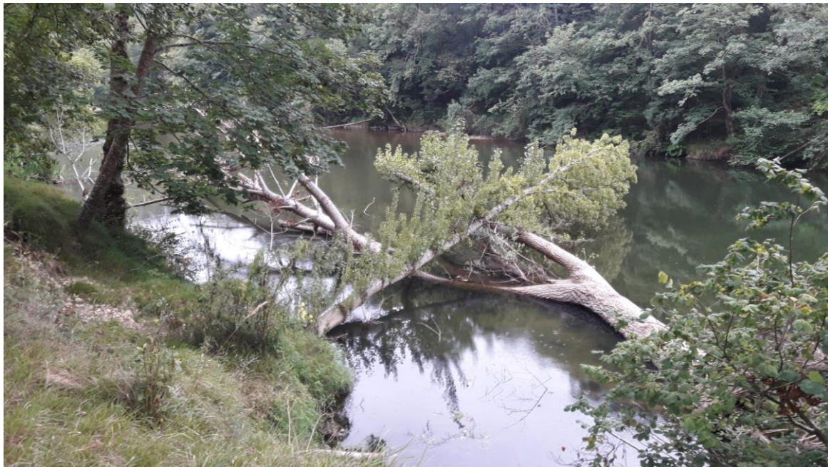
Estado previo a la actuación