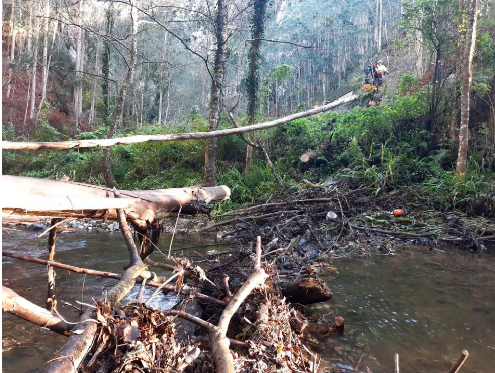
Retirada de arbolado