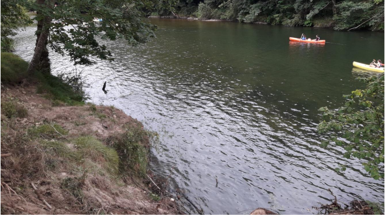
Estado posterior a la actuación