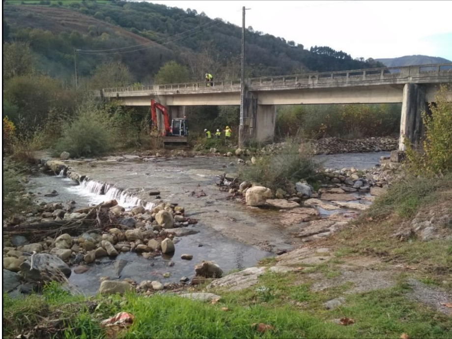
Inicio de las actuaciones con maquinaria