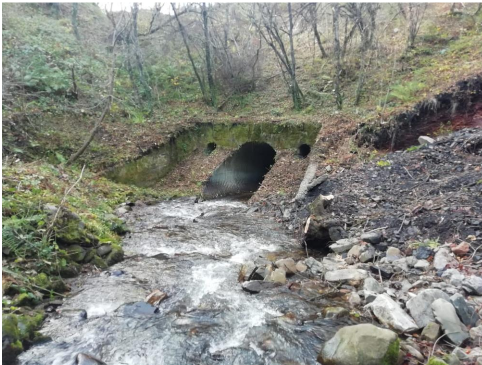
Estado posterior a la actuación