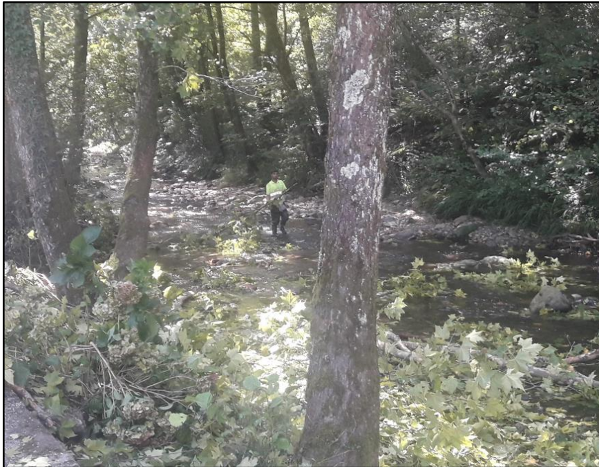
Actuaciones de retirada de ramaje con riesgos de caída