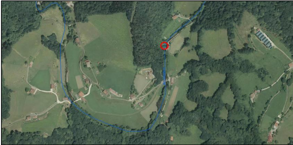
Localización de la actuación en río Tximista