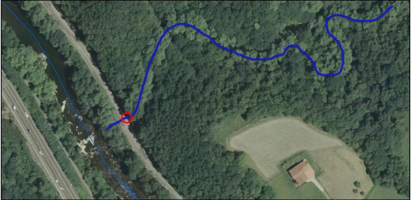
Localización de la actuación en regata Zumeldia