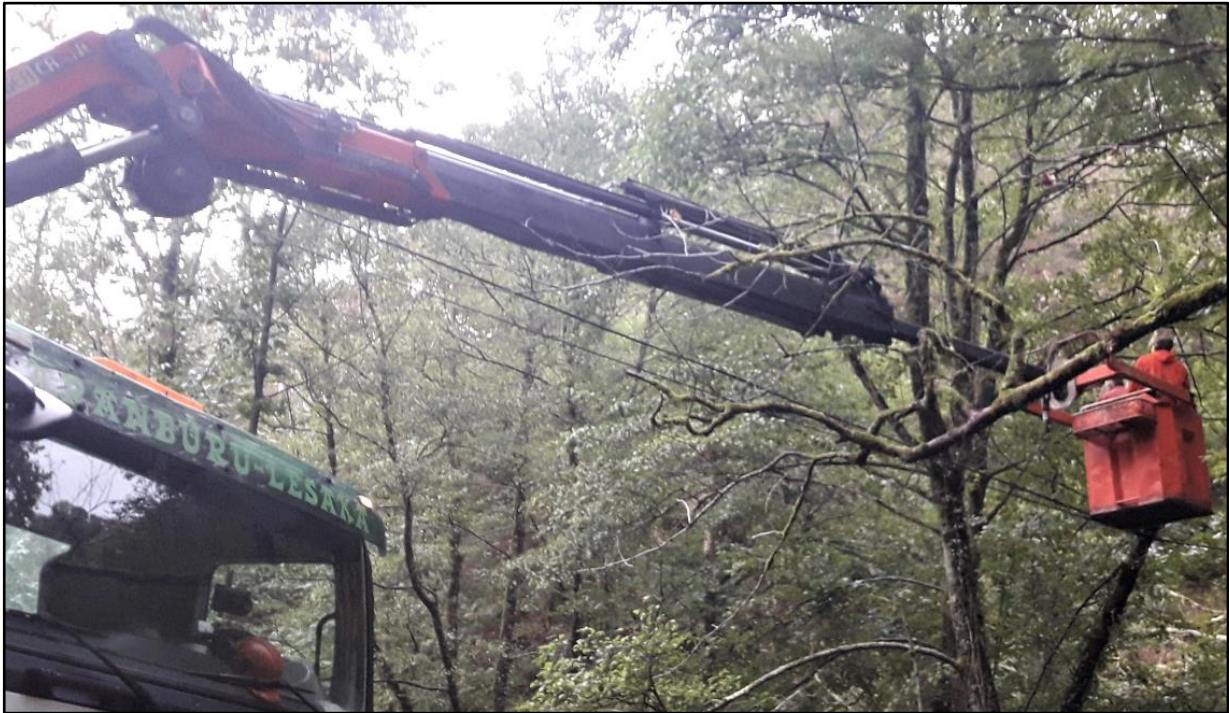
Poda en altura en el entorno de una línea telefónica