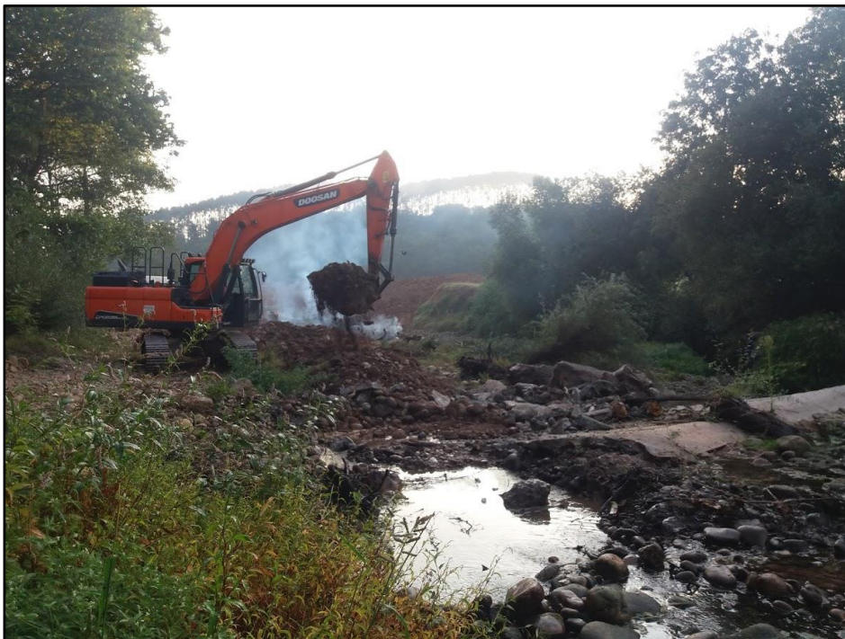
Inicio de las actuaciones con maquinaria