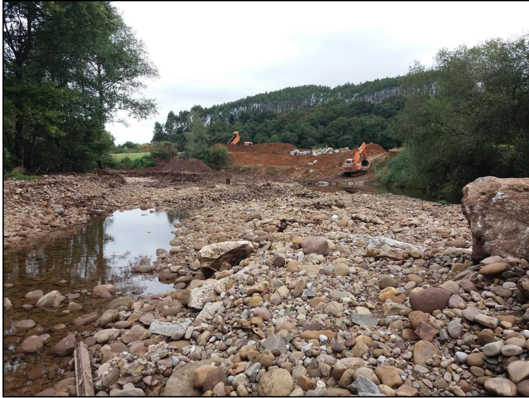
Actuaciones con maquinaria, se observa margen derecha erosionada