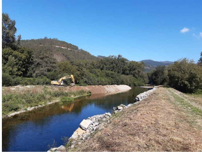
Inicio de los trabajos