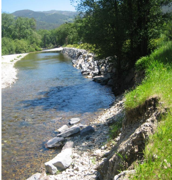
Detalle de la zona a reparar