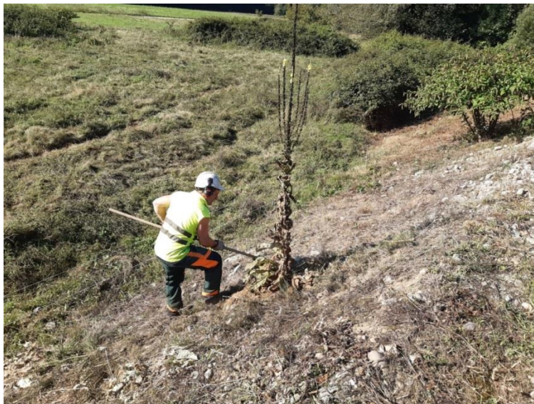
Eliminación de plantas invasoras