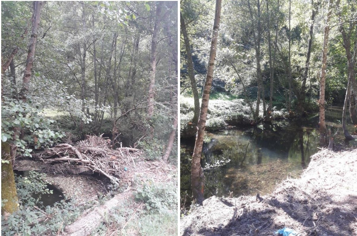
Imágenes previa y posterior a la actuación