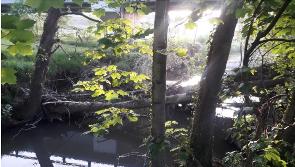
Río Nora en Fonciello