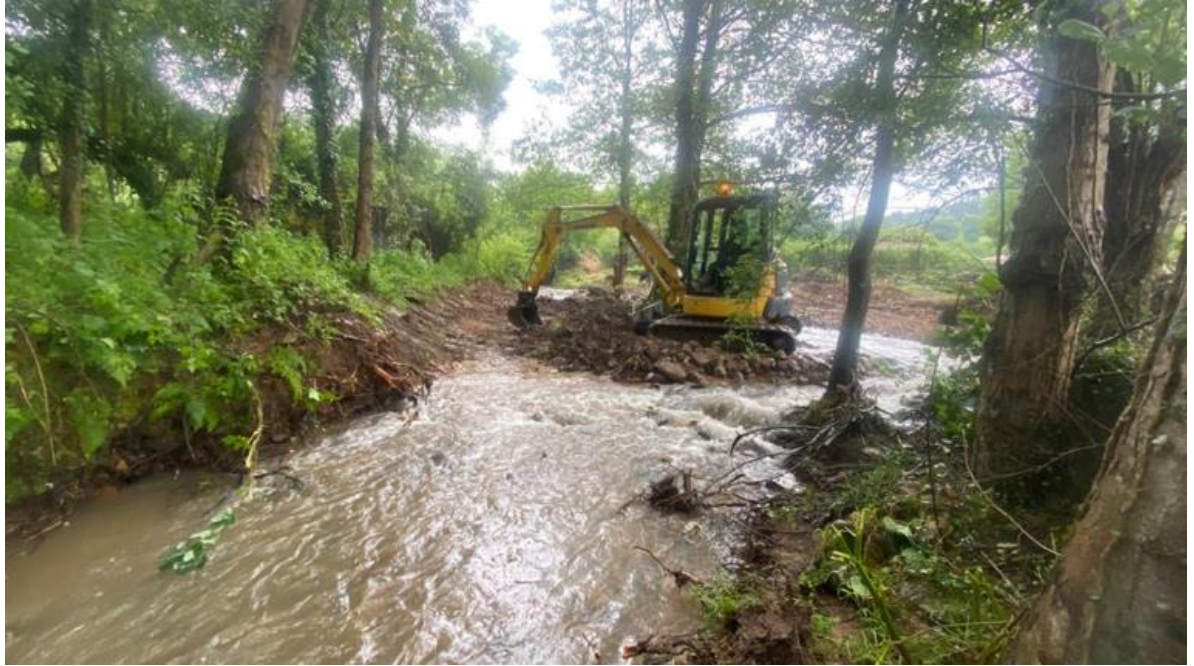
Arroyo Gaspar en Niserinos