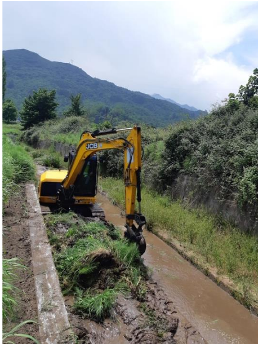
Arroyo de los Molinos en Argame.