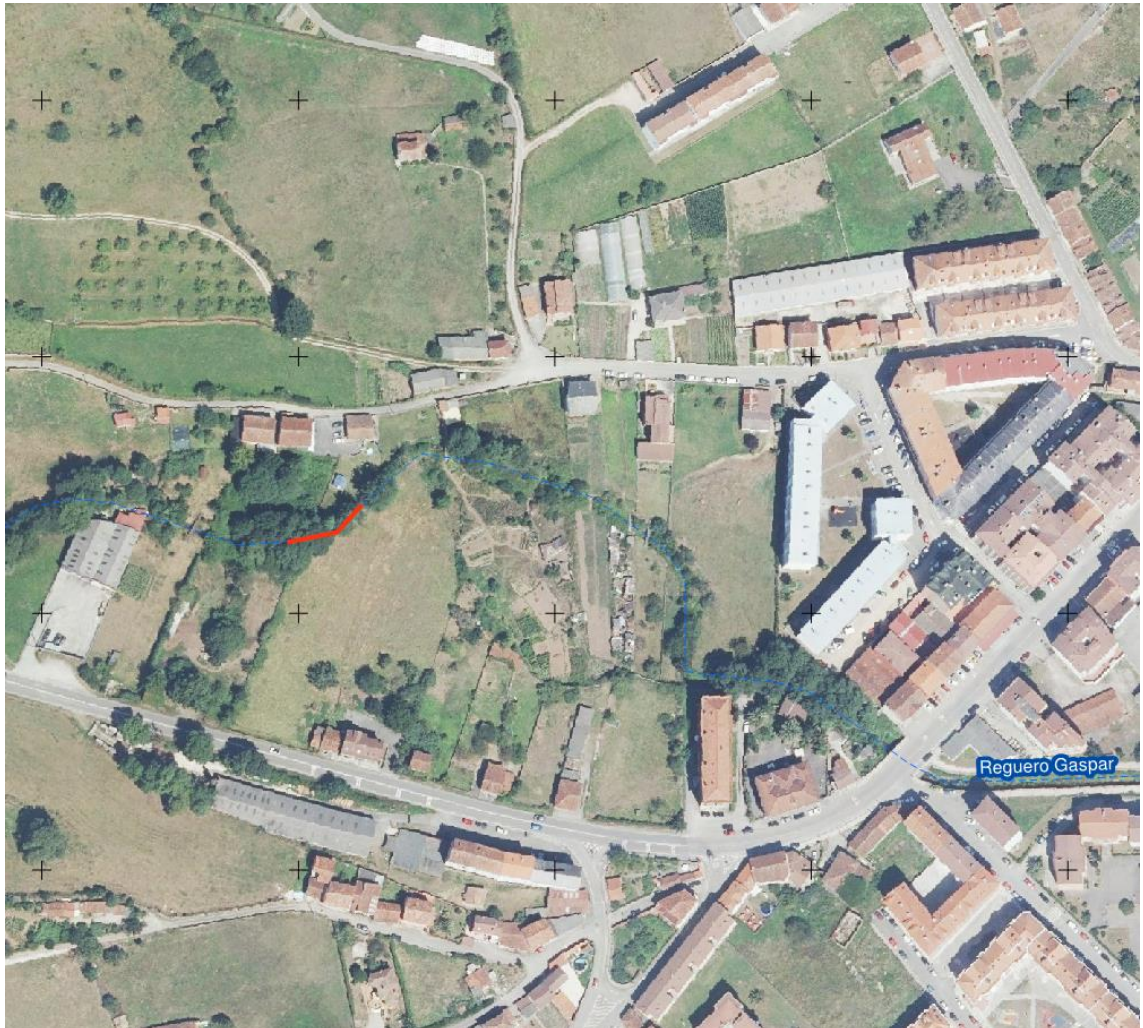
Localización de las actuaciones realizadas en el arroyo Gaspar en la zona de Niserinos (T.M. de Grado)