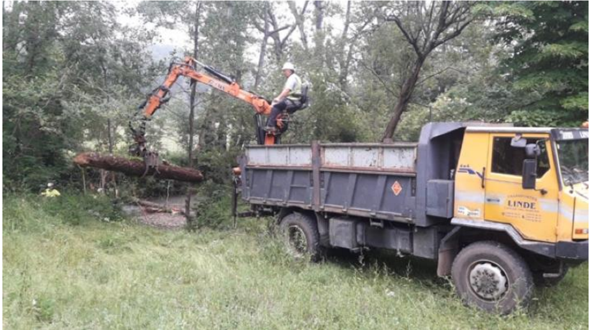
Río de Pra o Fuensanta en Piloñeta (Nava)