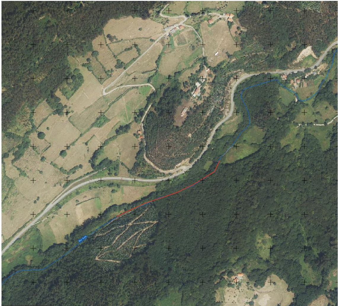
Localización de las actuaciones en el río Soto en las proximidades de la Hoya (T.M. de Las Regueras)