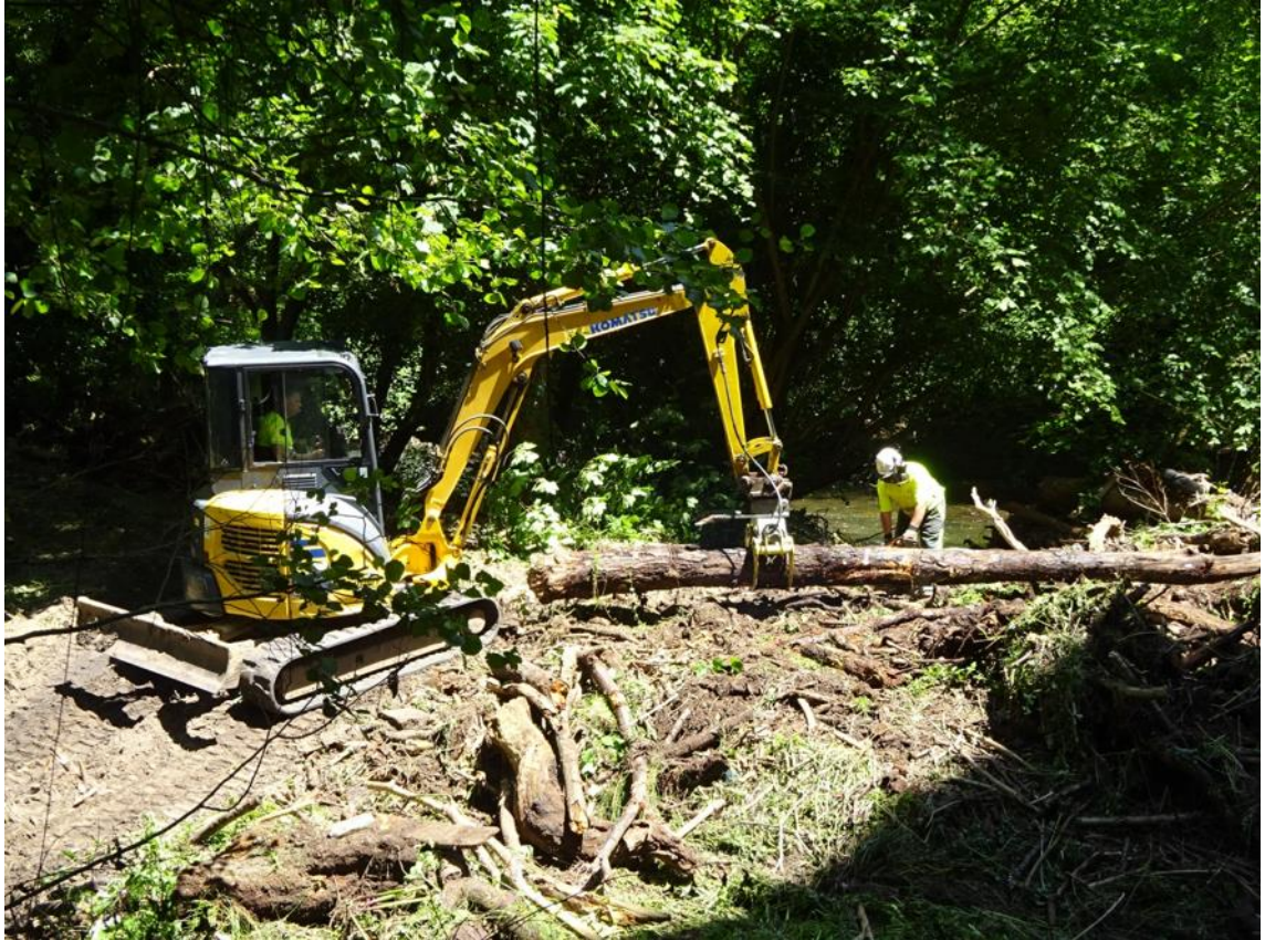
Río Nora en Campanal