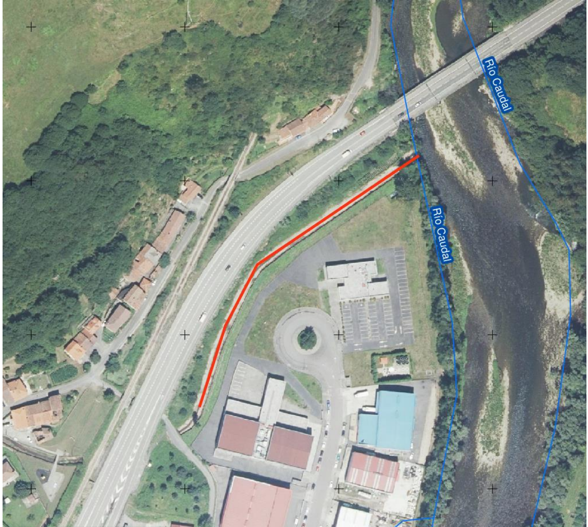
Localización de las actuaciones en el río Nalón en las proximidades de Argeme (T.M. de Morcín)