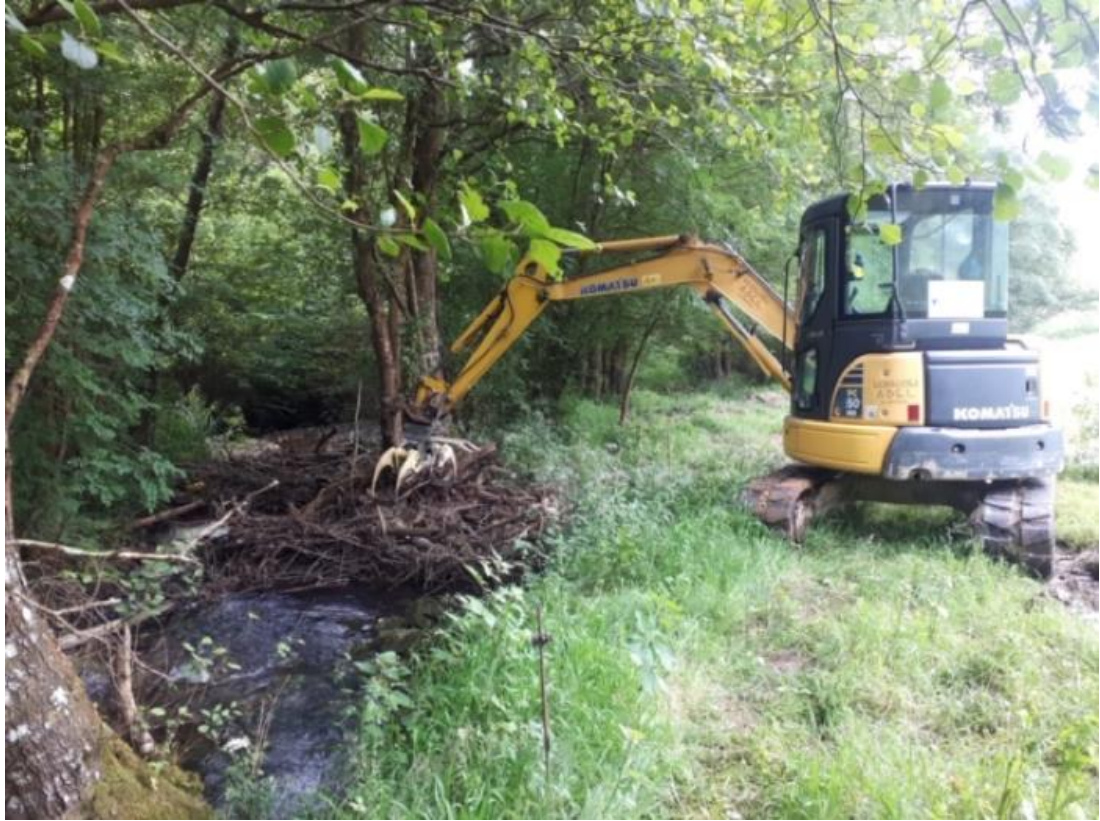
Río Soto en La Hoya (T.M. de Las Regueras)