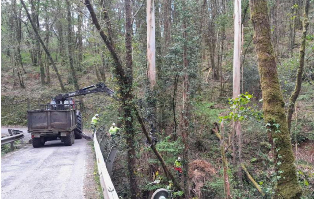
Durante los trabajos: autocargador y operarios retirando árbol caído