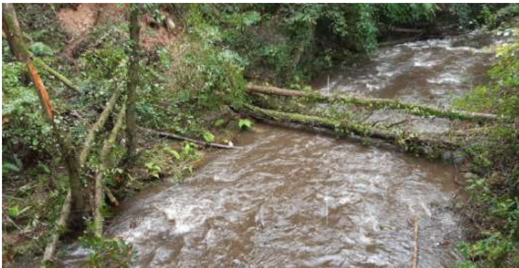
Antes de los trabajos: árboles caídos perpendicularmente al cauce