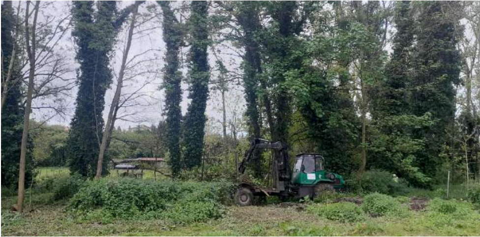
Autocargador retirando restos vegetales