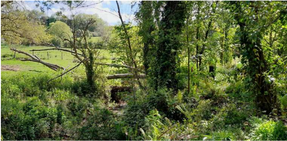
Antes de los trabajos