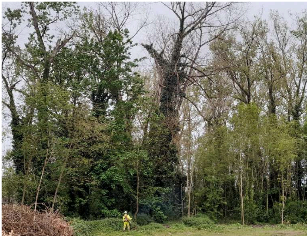
Operario desbrozando zona de entrada a la actuación