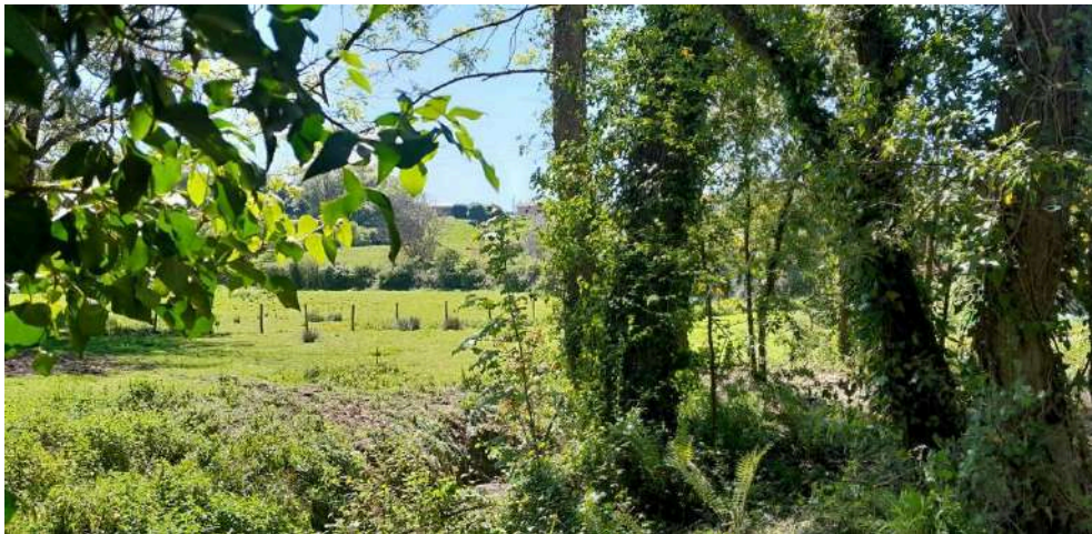
Después de los trabajos